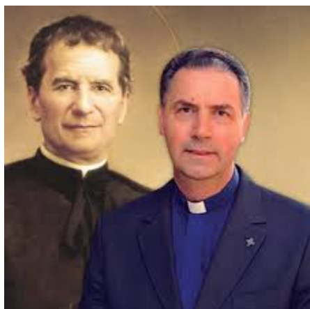
Don Ángel Fernández Artime Rector Mayor Congregación Salesiana

“¡Con los jóvenes, para los jóvenes! ...especialmente los más pobres.”