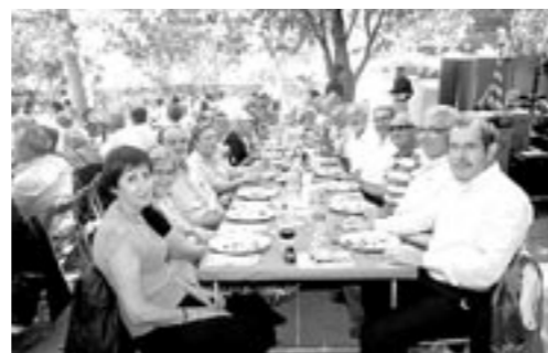
Cisco y Virtu (Grupo Terrassa)

Ha sido un fin de semana de convivencia muy aprovechado en que el grupo ha estado muy unido. La experiencia ha resultado muy positiva.